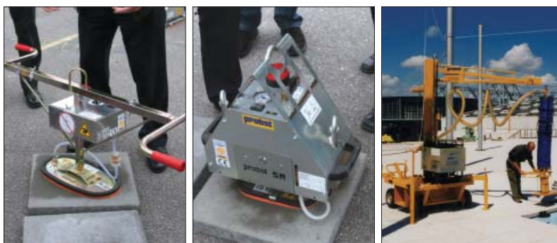
Yderst tv. en lille batteridrevet vakuumløfter. I midten en vakuumløfter der monteres på f.eks. en gravemaskine og drives af dennes hydraulik. Yderst th. en selvstændig vakuumløfter med stor luftflow. Det er kun de sidste to typer der kan være anvendelige til betonfliser.

Betonfliser er stort set altid støbt af jordfugtig beton (en meget tør be-