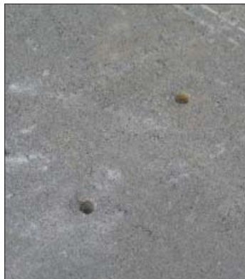
Har vakuumløfteren tilstrækkelig kapacitet skal den kunne løfte en 50 x 50 x 5 cm flise med 2 stk. 6 mm borede huller eller en fortovsflise (80 x 62,5 x 7 cm) med 1 stk. 6 mm hul.

Betonfliser vil som nævnt altid have en vis porøsitet, men via de kvalitetskrav der er til styrke og frostbestandighed, bør porøsiteten ikke kunne blive så stor, at korrekt dimensioneret og vedligeholdt udstyr ikke kan løfte fliserne. Er der fliser der ikke kan løftes, og