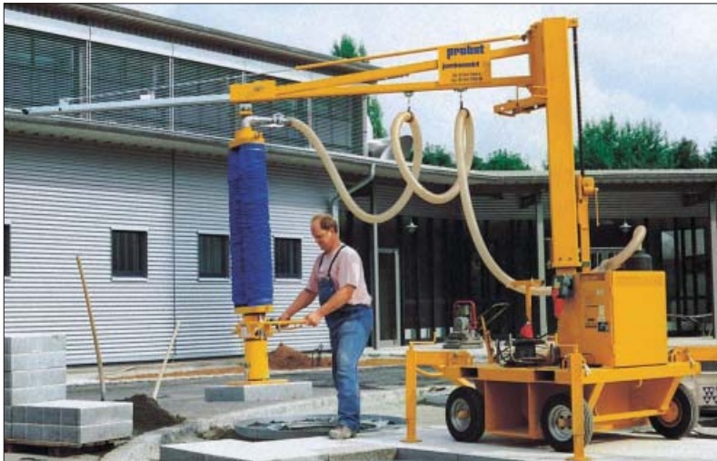
Brugen af vakuumløfteudstyr giver et godt arbejdsmiljø, men det medfører også en stor tidsmæssig besparelse ved større arealer.