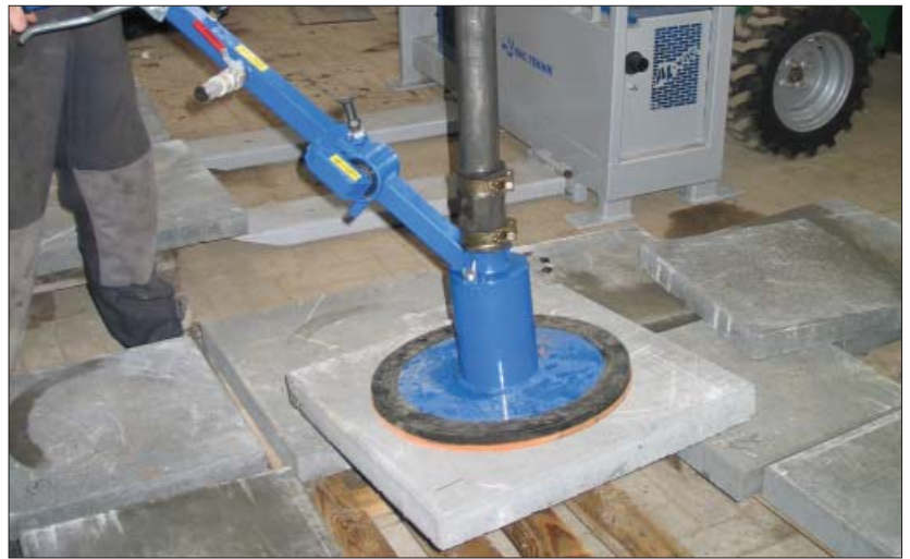
Før et maskinkøb bør der testes med en flise med et eller 2 stk. 6 mm huller i. Her en 50 x 50 x 5 cm flise med 2 stk. 6 mm huller.

Maskiner med vakuumpumpe vil typisk have et væsentligt højere luftflow end maskiner med en