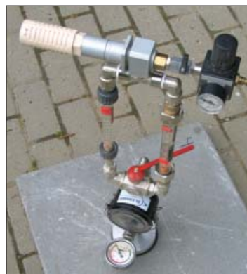
Udstyr til måling af porøsiteten af betonfliser.

Forsøgene viste desuden, at skumlæben der lægger an mod flisen, er et svagt punkt ved maskinerne. Er den stiv eller deform kan der ikke dannes vakuum. Ofte vil en opvridning af pakningen i varmt vand hjælpe.