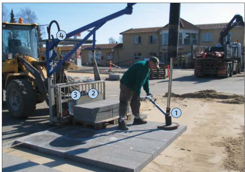
Vakuumløfteudstyret har flere dele der skal være fokus på: 1. Pakning ved mundstykke. 2. Luftfilter ved pumpe/turbine. 3. Pumpe/turbine, slitage. 4. Utætheder ved samlinger.

Endvidere vil der altid foregå en udfældning af kalk enten inde i stenen eller på overfladen, hvilket også er med til at tætte flisen.